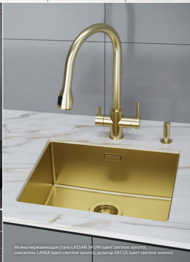
Мойка нержавеющая сталь LASSAN 54 UNI (цвет светлое золото), смеситель LANGE (цвет светлое золото), дозатор DECUS (цвет светлое золото)