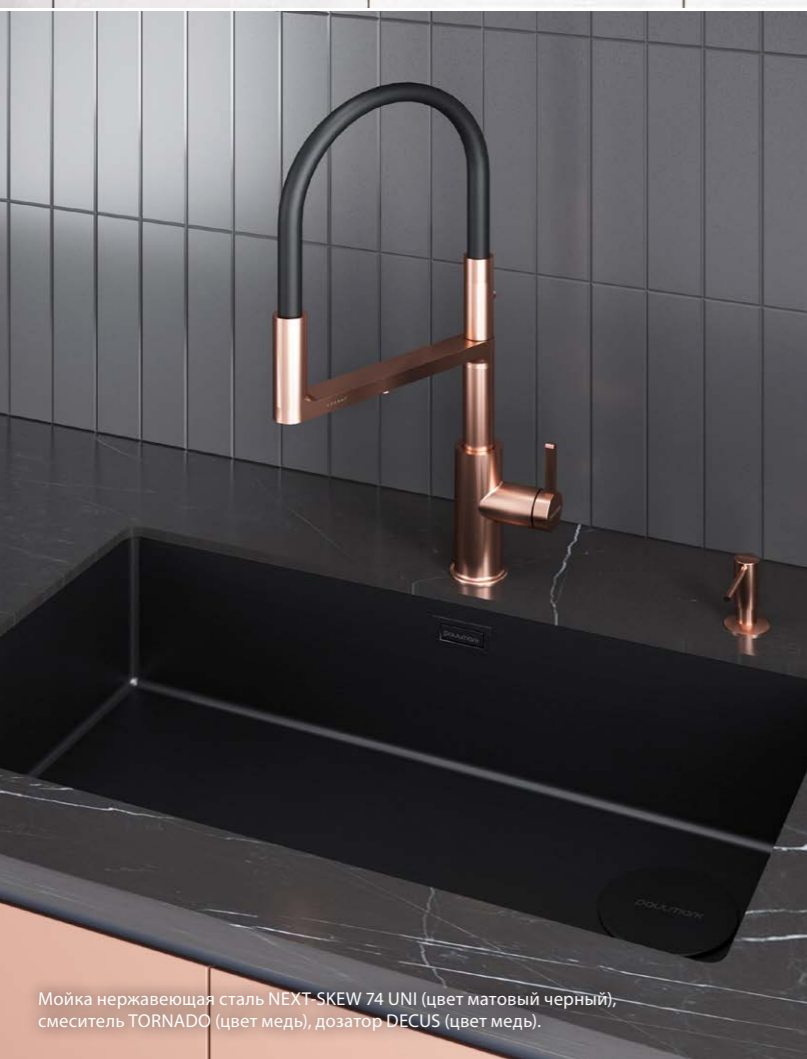
Мойка нержавеющая сталь NEXT-SKEW 74 UNI (цвет матовый черный), смеситель TORNADO (цвет медь), дозатор DECUS (цвет медь)