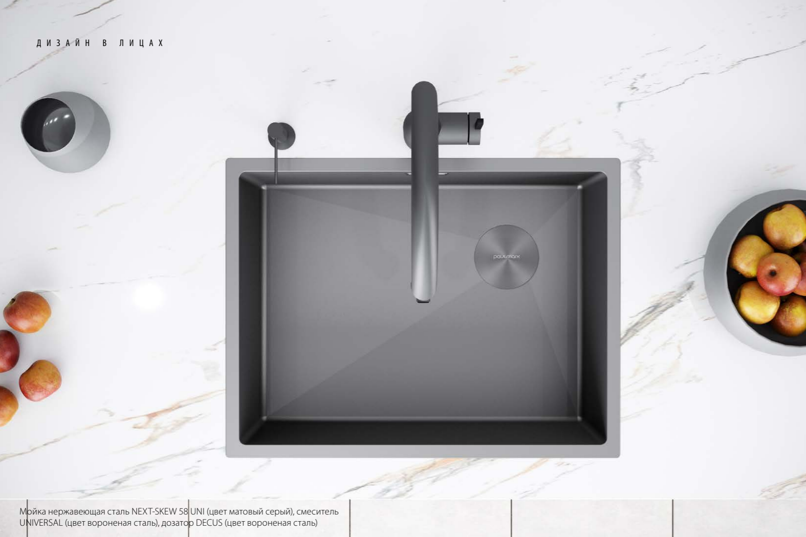
Мойка нержавеющая сталь NEXT-SKEW 58 UNI (цвет матовый серый), смеситель UNIVERSAL (цвет вороненая сталь), дозатор DECUS (цвет вороненая сталь)

Основатель бренда сантехники для кухни PAULMARK